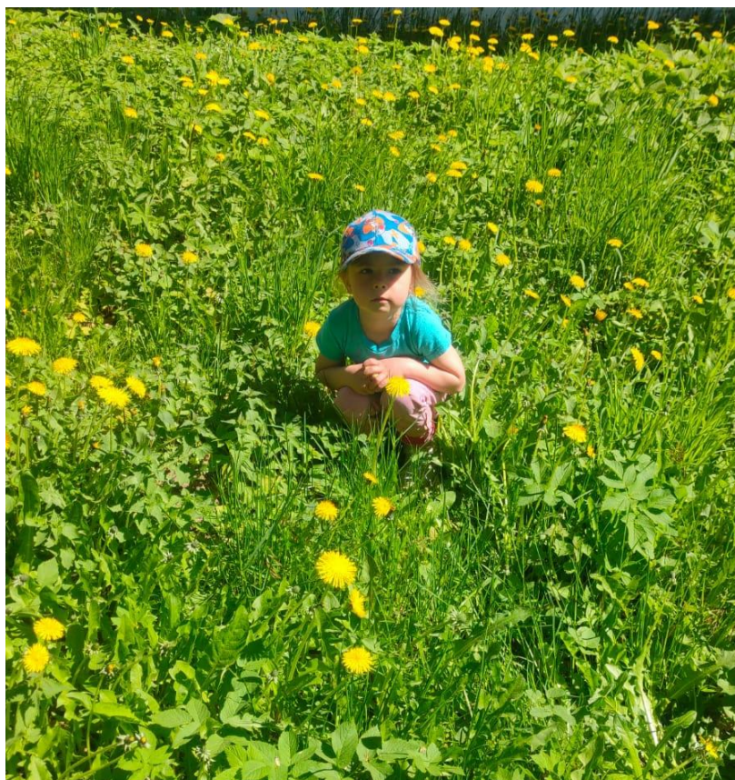
Цветы похожие на солнышко.